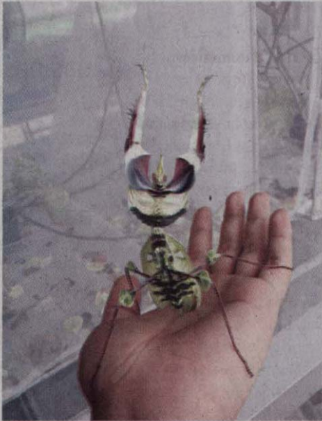
ตั๊กแตนตำข้าวดอกไม้ปีศาจราชนิแห่งตั๊กแตนตำข้าว