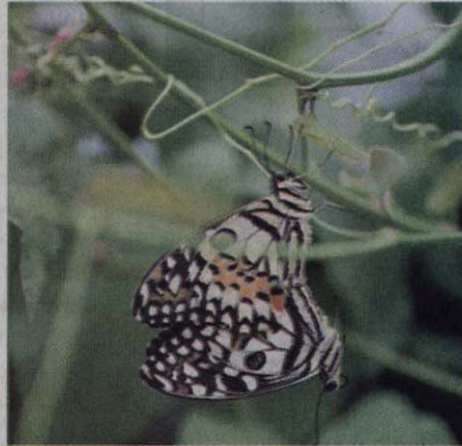
ผีเสื้อเขตร้อน